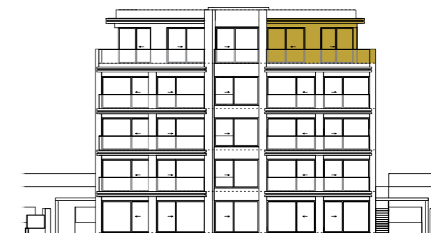
SEVEROVÝCHODNÍ POHLED NORTHEAST VIEW

Výhrada / Reservation: Vybavení a zařízení v plánech bytů (nábytek, kuchyňská linka, spotřebiče, vestavěné skříně, atd.), stejně jako markýzy nejsou součástí dodávky. Rozsah dodávky je specifikován ve standardech bytu. Investor si vyhrazuje právo na změnu. The furnishings and equipment shown in the apartment plans (furniture, kitchen unit, appliances, built-in cabinets etc.), as well as awnings are not included in the delivery. The scope of the delivery is specified in the standards of the apartment. The investor reserves the right to change.