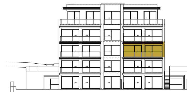
SEVEROVÝCHODNÍ POHLED NORTHEAST VIEW

Výhrada / Reservation: Vybavení a zařízení v plánech bytů (nábytek, kuchyňská linka, spotřebiče, vestavěné skříně, atd.), stejně jako markýzy nejsou součástí dodávky. Rozsah dodávky je specifikován ve standardech bytů. Investor si vyhrazuje právo na změnu. The furnishings and equipment shown in the apartment plans (furniture, kitchen unit, appliances, built-in cabinets etc.), as well as awnings are not included in the delivery. The scope of the delivery is specified in the standards of the apartment. The investor reserves the right to change.