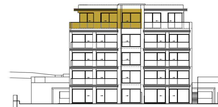
SEVEROVÝCHODNÍ POHLED NORTHEAST VIEW

Ke každé bytové jednotce náleží sklep a garážové, nebo parkovací stání. To each apartment unit belongs a cellar, a garage space or a parking slot.