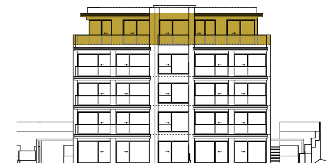
SEVEROVÝCHODNÍ POHLED NORTHEAST VIEW

Výhrada / Reservation : Vybavení a zařízení v plánech bytů (nábytek, kuchyňská linka, spotřebiče, vestavěné skříně, atd.), stejně jako markýzy nejsou součástí dodávky. Rozsah dodávky je specifikován ve standardech bytu. Investor si vyhrazuje právo na změnu. The furnishings and equipment shown in the apartment plans (furniture, kitchen unit, appliances, built-in cabinets etc.), as well as awnings are not included in the delivery. The scope of the delivery is specified in the standards of the apartment. The investor reserves the right to change.