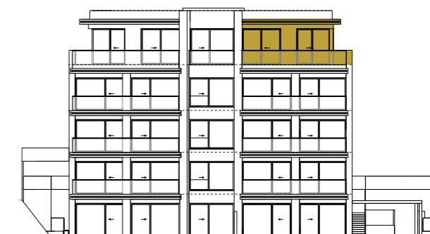
SEVEROVÝCHODNÍ POHLED NORTHEAST VIEW

Výhrada / Reservation: Vybavení a zařízení v plánech bytů (nábytek, kuchyňská linka, spotřebiče, vestavěné skříně, atd.), stejně jako markýzy nejsou součástí dodávky. Rozsah dodávky je specifikován ve standardech bytů. Investor si vyhrazuje právo na změnu. The furnishings and equipment shown in the apartment plans (furniture, kitchen unit, appliances, built-in cabinets etc.), as well as awnings are not included in the delivery. The scope of the delivery is specified in the standards of the apartment. The investor reserves the right to change.